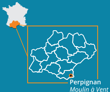
Perpignan Moulin à Vent